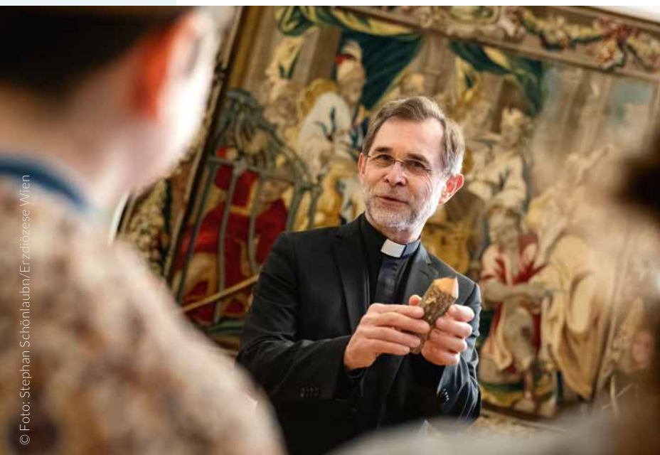
Josef Grünwidl im Gespräch. Glauben weitergeben heißt zuhören, erklären und Brücken bauen.

DANKEN WIR GOTT FÜR UNSEREN ER- NANNTEN ERZ- BISCHOF UND SEINEN MUTI- GEN BLICK IN DIE ZUKUNFT.